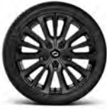
INSPIRE 전용 19" 알로이 휠