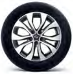
17" 투톤 알로이 휠