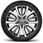
19" 투톤 알로이 휠