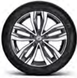
18" 투톤 알로이 휠