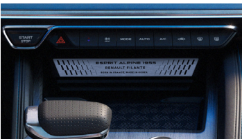
esprit Alpine 1955 전용 내임 플레이트