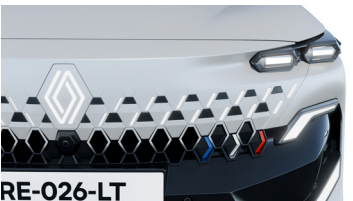
프론트 그릴 데코