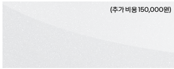
클라우드 펄 Cloud Pearl