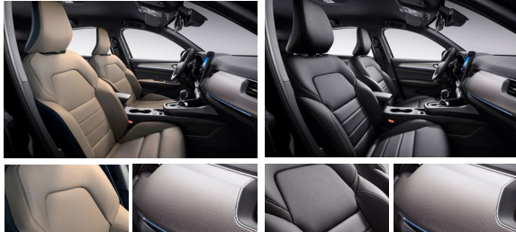
카멜 브라운 인조 가죽 시트(Iconic 선택) 하이드로 텍사곤 데코(Iconic) 블랙 헤드라이너 & 골드 스티치(Iconic)