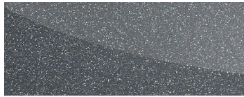
어반 그레이 Urban Grey