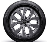
17" 다크 그레이 휠